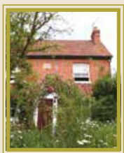
THE BACH CENTRE, MOUNT VERNON

Így születtek az eredeti Bach®-virágeszenciák, melyek támogatást nyújthatnak azokban az érzelmi kihívásokban, amikkel a mindennapi élet során találkozunk. Az Originál Bach®-virágeszenciák népszerűsége 1930 óta töretlen, ma már több millió ember használja szerte a világon Bach doktor cseppjeit.