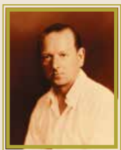
DR EDWARD BACH

Dr. Edward Bach (1886-1936) angol orvos már az 1930-as években kulcsfontosságúnak tartotta, hogy megismerje betegei érzelmi- és gondolatvilágát, és ezt figyelembe véve kezelje őket.